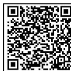
(學校網域 QR Code)